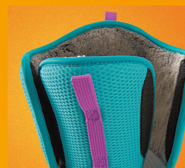
STRAP CUFF CLOSURE