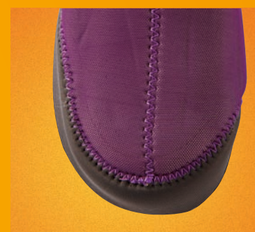
FLEX TOE WINDOW