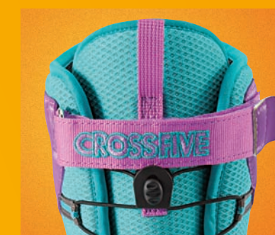
STRAP CUFF CLOSURE